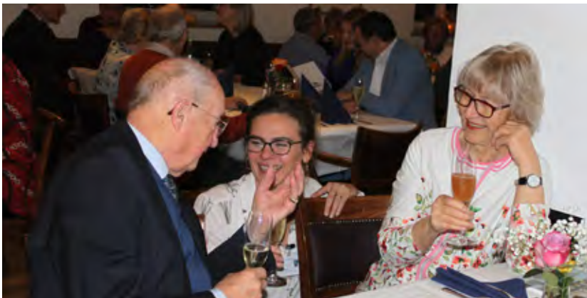
Ein Unterhaltsamer Abend