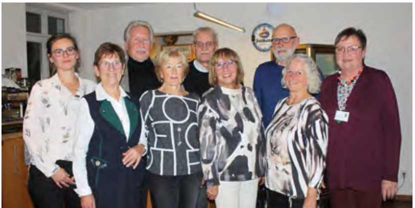
Unsere Jubilare 2024