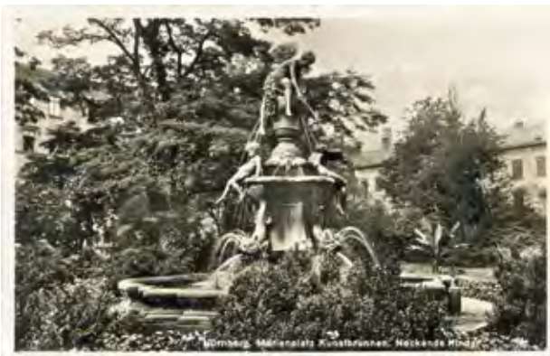
Ansichtskarte des Marienplatz mit dem Zadow Brunnen. Ansichtskarte um 1910.

Die Stadt hatte kurz zuvor zwei große Gartengrundstücke, den Gleisbühl und den Scherlersgarten, erworben, um dort die Marienvorstadt anzulegen. Der angrenzende Flaschenhof gehörte jedoch nicht dazu. Um die Marienstraße nach Plan gerade bis zur Regensburger Straße zu führen, hätte ein Ecke des Flaschenhofs genutzt werden müssen. Doch der Eigentümer weigerte sich, nur einen kleinen Teil abzugeben, und verlangte den Verkauf des gesamten Grundstücks. Da die Stadt dies aus finanziellen Gründen ablehnte, führte der städtische Baurat Bernhard Solger die Straße zunächst um das Grundstück herum. Erst später konnte die Marienstraße tatsächlich geradlinig fortgeführt werden. Zu diesem Zeitpunkt waren jedoch bereits Grundstücke verkauft und teilweise bebaut worden, sodass eine rechteckige Freifläche entstand, die bald den Namen „Marienplatz“ erhielt. Die Gestaltung des Platzes orientierte