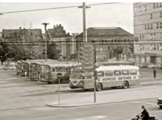
Der Marienplatz diente lange als städtischer Busbahnhof. Fotografie 1961.