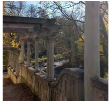
Blick in den herbstlichen Tullnaupark

Textquelle: Servicebetrieb Öffentlicher Raum, Stadt Nürnberg