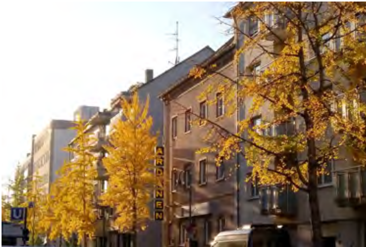
Ginkobäume am Rennweg, Foto: Claudia Waitz

“Sie sind immer ein schöner Anblick, nicht nur im Herbst sondern auch im Frühjahr und im Sommer spenden sie Schatten. Inzwischen gibt es auch das Café Ginko an der Ecke, wo man unter dem Ginkobaum sitzen kann. Bleibt nur zu hoffen, dass endlich auch die U-Bahn-Kuppeln saniert werden, da würde dieser Abschnitt des Rennwegs fast ein Boulevard.”