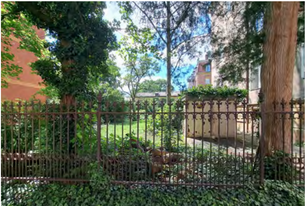
Blick auf das Gartengrundstück

im Stadtteil Wöhrd, insbesondere im Bereich der Gemarkung „Gärten bei Wöhrd“, herrscht in der Bevölkerung Unruhe und Besorgnis. Für einen Antrag auf Vorbescheid zur Errichtung einer Wohnanlage mit Tiefgarage in der Nunnenbeckstraße 28 wurden seitens der Grundstückseigentümerin die Nachbarn in der Rudolphstraße 7 um Zustimmung zum Vorhaben gebeten. Die Eigentümergemeinschaft wendet sich einmütig und nachdrücklich gegen die vorgelegten Planungen.