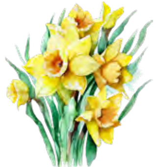
Begrüßung durch die Vorsitzenden