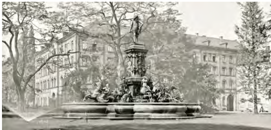
Der Neptunbrunnen auf dem Marienplatz, Fotografie 1938.

Ludwig Gerngros gestiftet wurde und ursprünglich auf dem Hauptmarkt stand. Wegen antisemitischer Proteste gegen die jüdischen Stifter wurde er 1934 entfernt und auf den Marienplatz versetzt. Dort überstand der Brunnen den Zweiten Weltkrieg weitgehend unbeschadet.